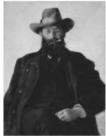
Erik Werenskiold malte et frodig portrett av Helland i 1885.

Amund Theodor Helland , født i Bergen i 1846, var en norsk geolog, professor og politiker (Venstre).