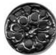
Smykke – kopi av løsfunn fra Øisund.

Fra stenalderen er et fund ved Vaatvik . En kniv af skifer, 8 cm. lang med fint sleben eg.