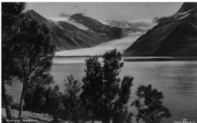
Engenbræen, en gren av ismassivet Svartisen, her sett fra Braset i Holandsfjorden.

Fra bunden af Nordfjorden gaar en dal op mod Svartisen. Det er en sækkedal med bratte sider og svære høider omkring. De lavere, jevnere dele har noget løvskog og krat. I den øverste del opunder Svartisen mellem Røsttind , 1.135 m., og Frokosttind , 1.125 m., er dalen brat og lidet tilgængelig.